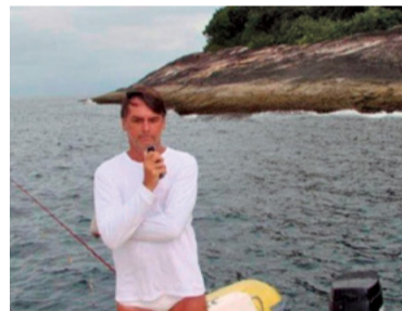
Por justa causa?