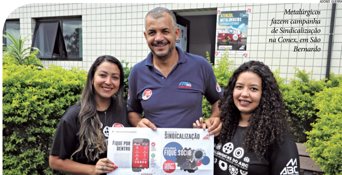
Metalúrgicos fazem campanha de Sindicalização na Conex, em São Bernardo

CAMINHADA DO SILÊNCIO PELAS VÍTIMAS DO PASSADO E CONTRA A VIOLÊNCIA: Domingo, 31, 16h, no Parque do Ibirapuera, Praça da Paz. Levar velas, flores e fotos das vítimas a serem lembradas.